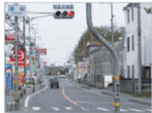
桑間交差点、新加茂橋西詰交差点での 渋滞解消!

桑間交差点 洲本市納～宇山間3.6kmの部分供用によって、現道からバイパスに交通が転換。